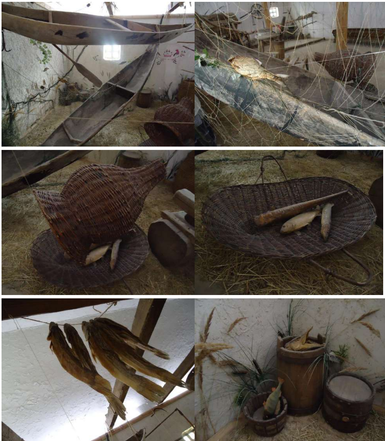
Експонати виставки «Традиційні промисли запорожців» Національного заповідника «Хортиця»: Човни, видовбані із стовбура дерева, знаряддя лову (сіть та ятір), посуд для переробки та зберігання риби (вагани, діжки)

Гільденштедт у своєму щоденнику підкреслював, що вилов риби вівся різними способами. Під час нересту, коли до рік заходило з моря багато риби, її навіть виловлювали руками або вигрібали на берег лопатами.