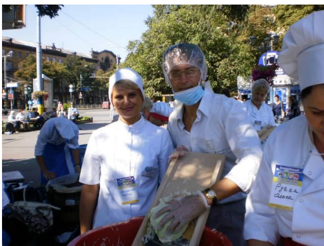
На Фестивалі консервації в підтримку воїнів АТО