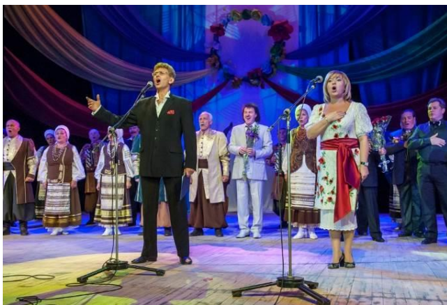
А. Сердюк на Концерті на підтримку воїнів АТО